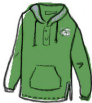
0. das Sweatshirt