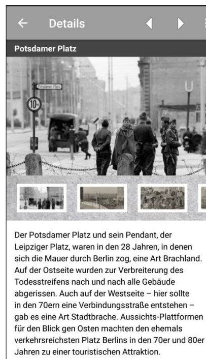
Beispiele | Screenshots erstellt von derdieDaF-Redaktion 2020