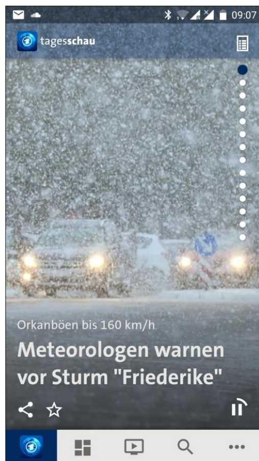
Screenshot: Tagesschau-App (Android), Startseite/Übersicht „Alle Nachrichten“

In der App findet man die wichtigsten Nachrichten der ARD (BR, hr, mdr, NDR, radiobremen, rbb, SR, SWR, WDR) und der Sportschau. Die App und ihre Inhalte sind kostenlos. Für den Abruf des Livestreams und der Videos aus Mobilfunknetzen wird eine