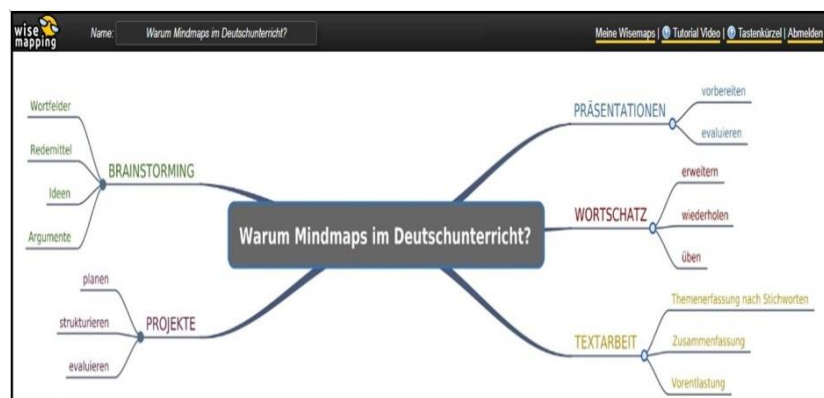
Beispiel für eine Mindmap mit dem Tool Wise Mapping , erstellt von der derdieDaF-Redaktion, Ernst Klett Sprachen GmbH, 2019. (Die App wurde beschrieben von Anika Kruse und Ingrid Scholz)

Anschließend kann die Mindmap z.B. über „Exportieren“ als Bild gespeichert, über „Drucken“ direkt ausgedruckt oder über „Mitbenutzen“ mit anderen Registrierten geteilt werden.